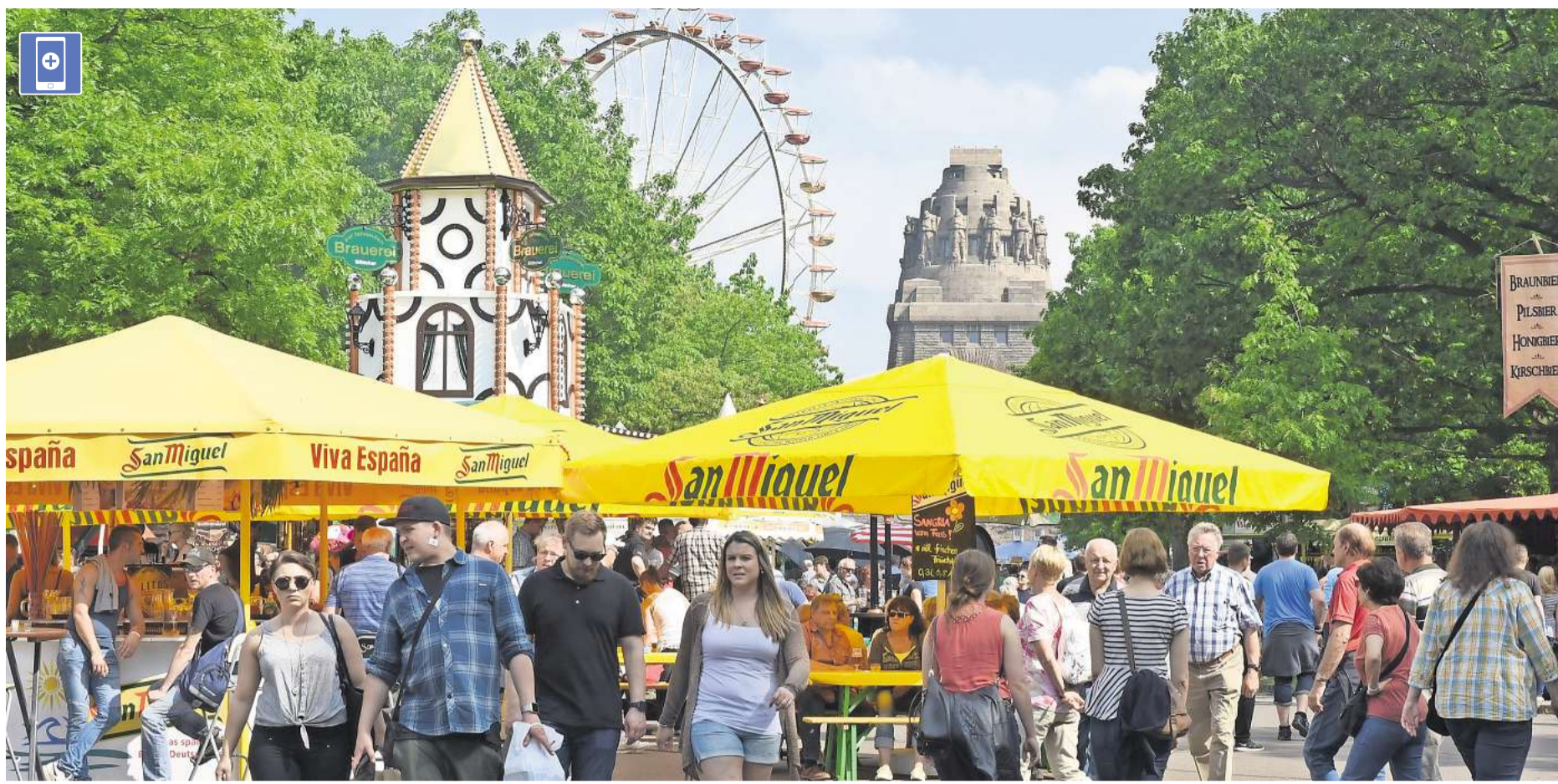
In Massen pilgern die Bier-Liebhaber über die 18. Leipziger Bierbörse am Völkerschlachtdenkmal. Craftbier - was ist das Besondere? Bitte Foto scannen und Video sehen.

25° Höchstwert heute Nachmittag 13° Tiefstwert in der Nacht zu morgen